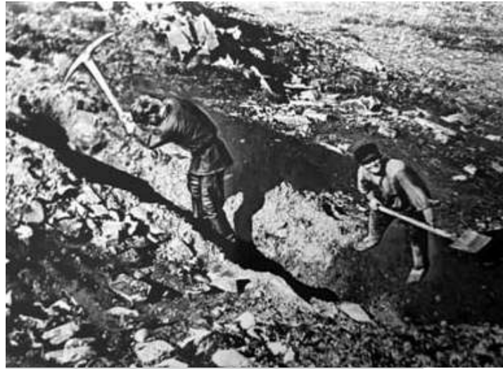
Первая канава на каменный уголь в обнажении №36 на реке Воркуте. 1930 год.