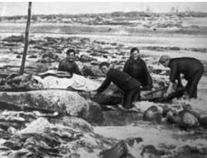
Протаскивание лодок через пороги реки Воркуты. 1930 год.

жил на выселке Тит, содержал скот, рыбачил и охотился. Так за что же он награждён? Для «национального колорита»? Правда, вчерашний отшельник вдруг оказался «на виду», — тысячи людей, сотни барж, двигавшихся к устью Воркуты, проходили теперь мимо выселка Тит, люди часто ночевали в доме Попова, в его сарае.