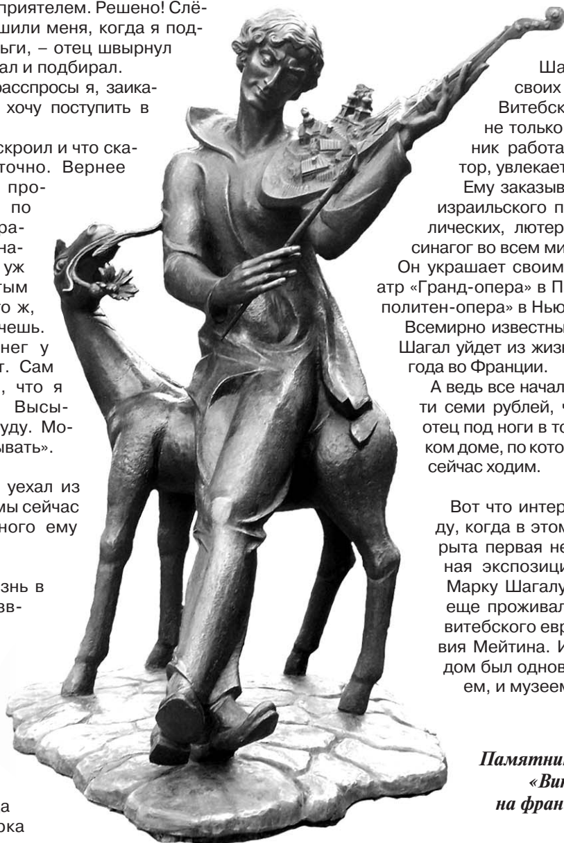
Памятник Марку Шагалу «Витебская мелодия на французской скрипке»