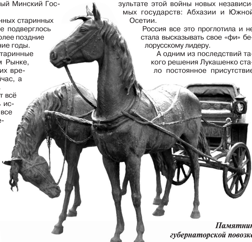
Памятник губернаторской повозке

А одним из последствий такого решения Лукашенко стало постоянное присутствие