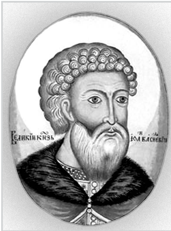
Великий князь Иван III Васильевич

«Еретикам ослаба пришла, – напишет святитель Геннадий суздальскому епископу Нифонту в январе 1488 года, – уже ныне наругаютца христьянству – вяжут кресты на вороны и на вороны. Многие ведели: ворон деи летает, а крестъ на нем вязан деревян, а ворона деи летает, а на ней крест медян. Ино таково наругание: ворон и ворона сядятца на стерве и на калу, а крестом по тому волочат! А zde се обретох икону у Спаса на Ильине улици – Преображение з деянием, ино в празницех Обрезание написано – стоит Василией Кесарийский, да у Спаса руку да ногу отрезал, а на подписи написано: Обрезание Господа нашего Иисуса Христа».