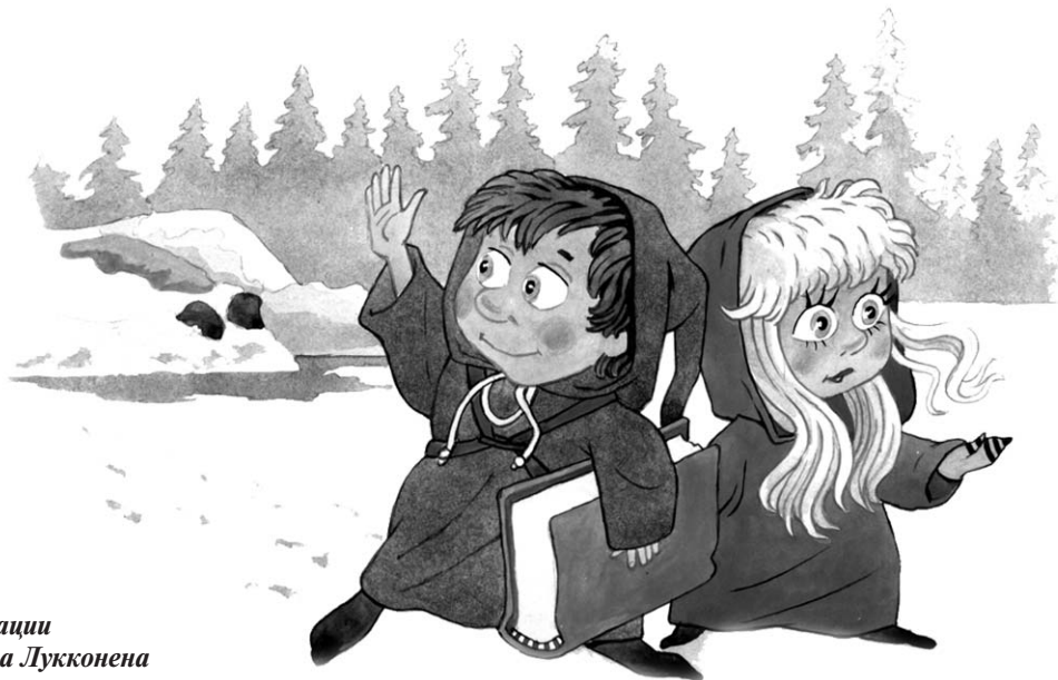
Иллюстрации Владимира Лукконена

— Пойдемте быстрее к Мудрому Зайцу. Он очень обрадуется, что мы нашли Петру!